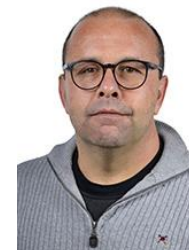
Deco Pagliosa Partido - PL