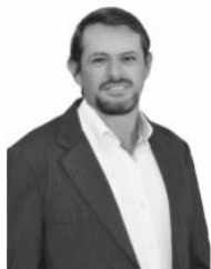
Zangallo Partido - PCdoB