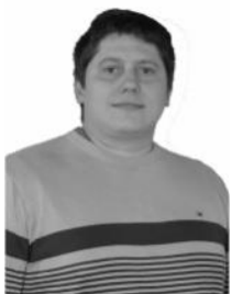
Rodrigo Grazziotin Partido - PCdoB